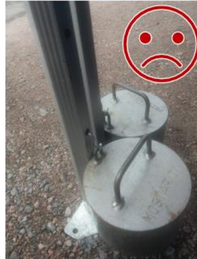
Kuva 10. Painojen teräskoukku ei ole lukittu. Teräs leikkaa alumiinia, jolloin kiinnitys ei ole toimiva.