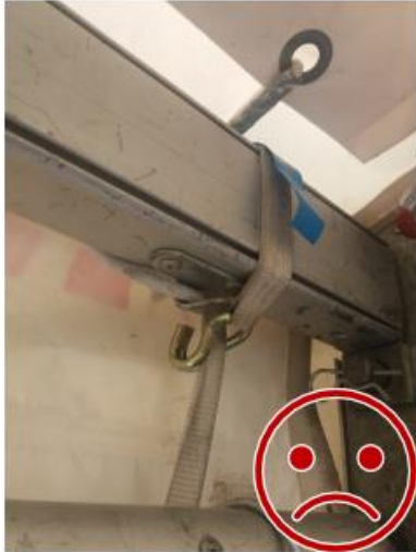
Kuva 9. Kuormaliina leikkaantuu kiristyessään.