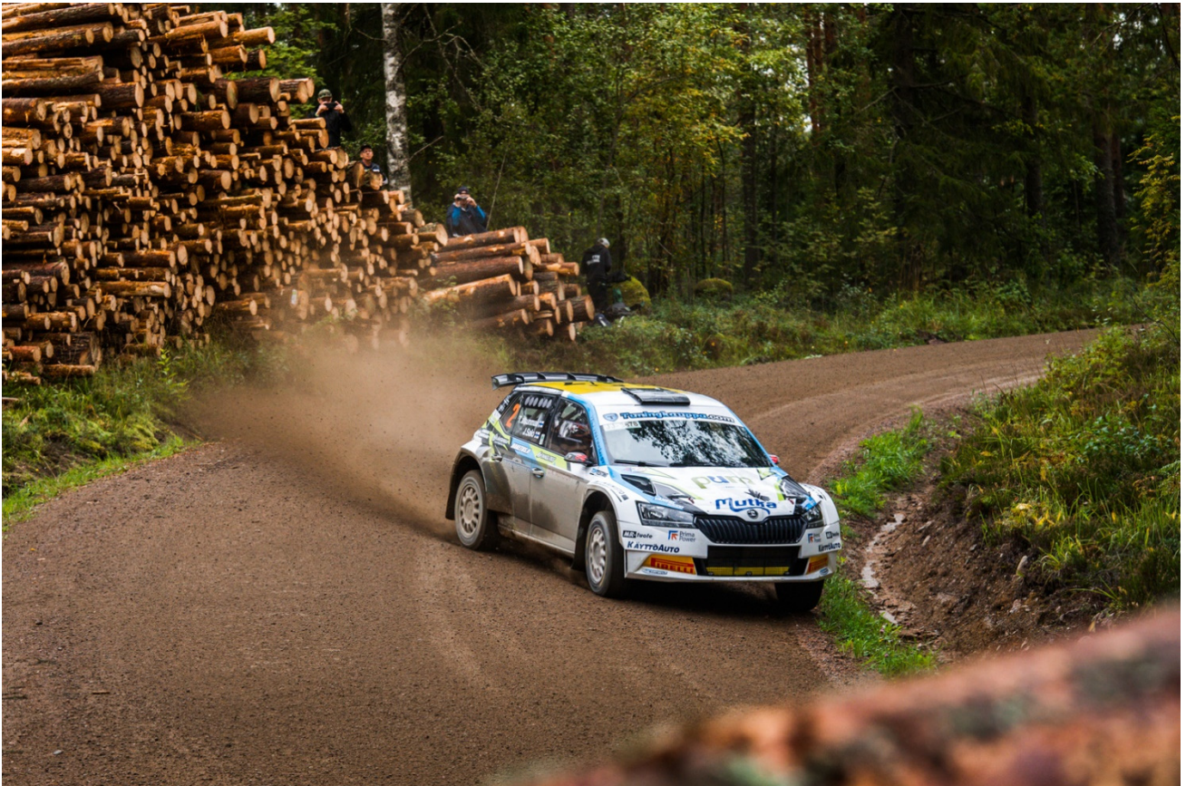
Taneli Niinimäki / AKK