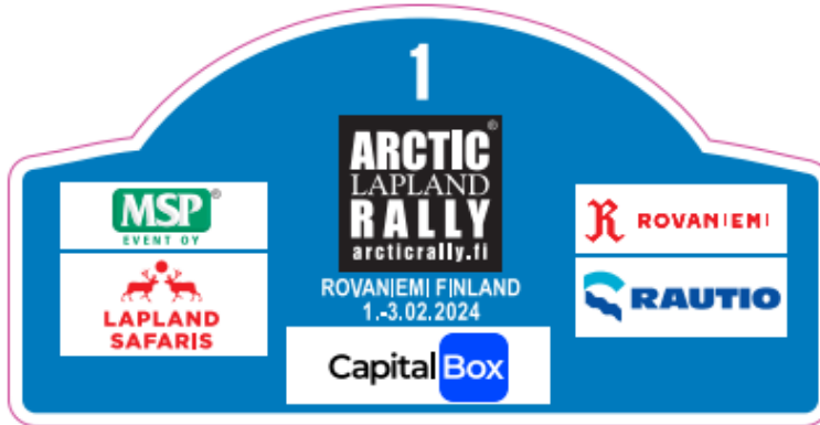
RALLYPLATE KUVA 2