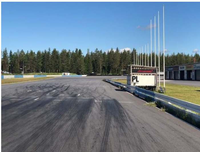
Valotaulu PL tekstin yläpuolella

Päälippupiste sijaitsee maalilinjan kohdalla radan oikeassa laidassa. Näytetään kilpailujohdon liputukset kilpailijoille