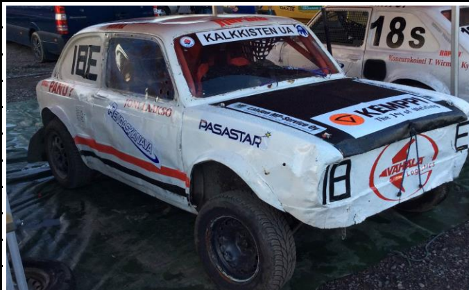
Valkoinen pääväri , mustat luukut ja kyljessä punainen ja musta raita