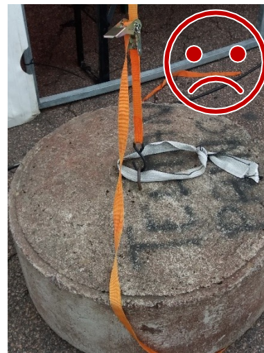
S-koukku irtoaa rakenteen joustassa tuulella. Kiinnitystä ei ole lukittu kiinnityspisteeseen.