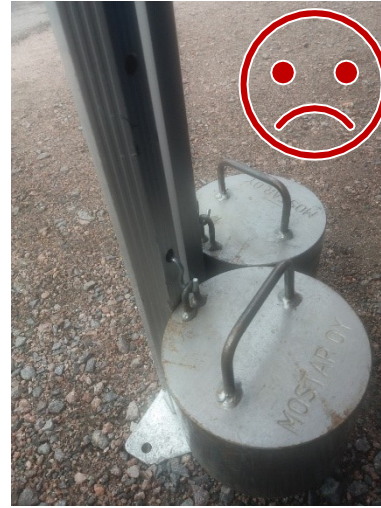
Painojen teräskoukku ei ole lukittu. Teräs leikkaa alumiinia, jolloin kiinnitys ei ole toimiva.